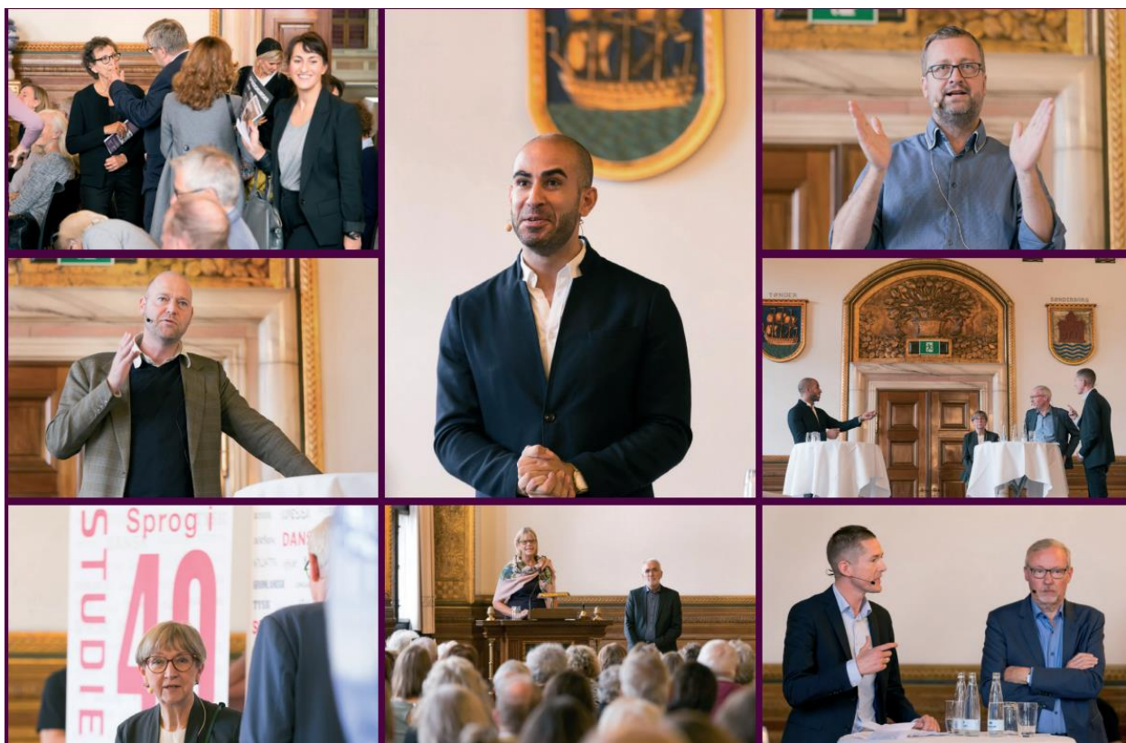
Billeder fra jubilæumseftermiddagen på Københavns Rådhus.

Vi var i festsalen på Københavns Rådhus, og der var fuldt hus! Efter oplæg og debat sluttede arrangementet med rådhuspandekager og bobler i Søjlegangen